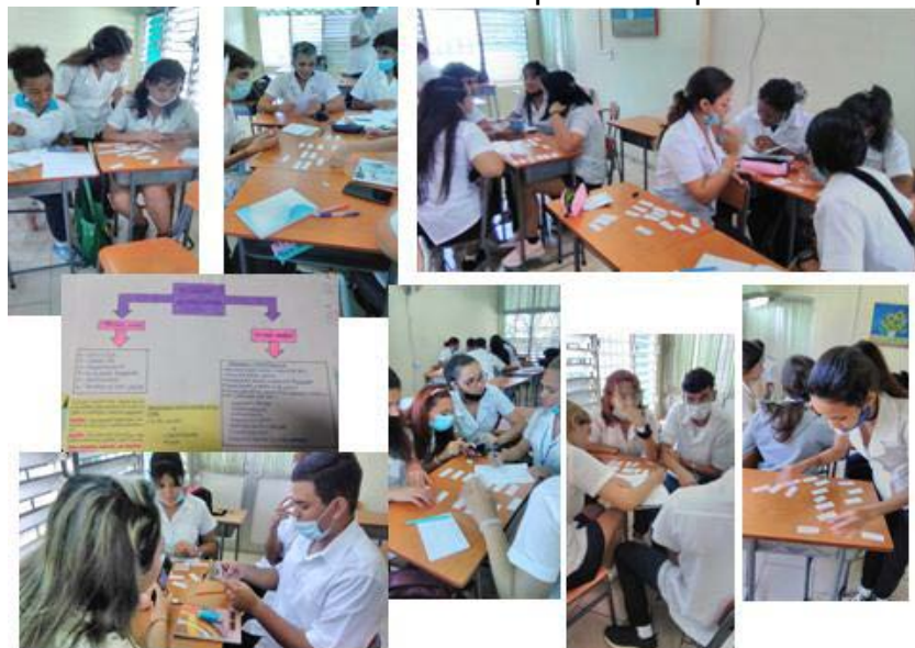
Figura 2. Estudiantes confeccionando mapas conceptuales en clase taller.

El profesor entregó algunos cartones (a modo de fichas de dominó) con palabras o conceptos para que los estudiantes conformaran el mapa conceptual, utilizando conectores, los cuales se incluyeron en una lista junto a distractores e instrucciones. Previamente se les entregó una guía para el estudio de la clase taller o clase práctica. Durante la actividad docente trabajaron en equipos completando el mapa (Figura 2). Posteriormente cada equipo al frente del aula explicó el contenido del mapa conceptual. El profesor revisó el mapa, si este estaba correcto, el equipo obtenía el máximo de puntos (en las actividades evaluadas).