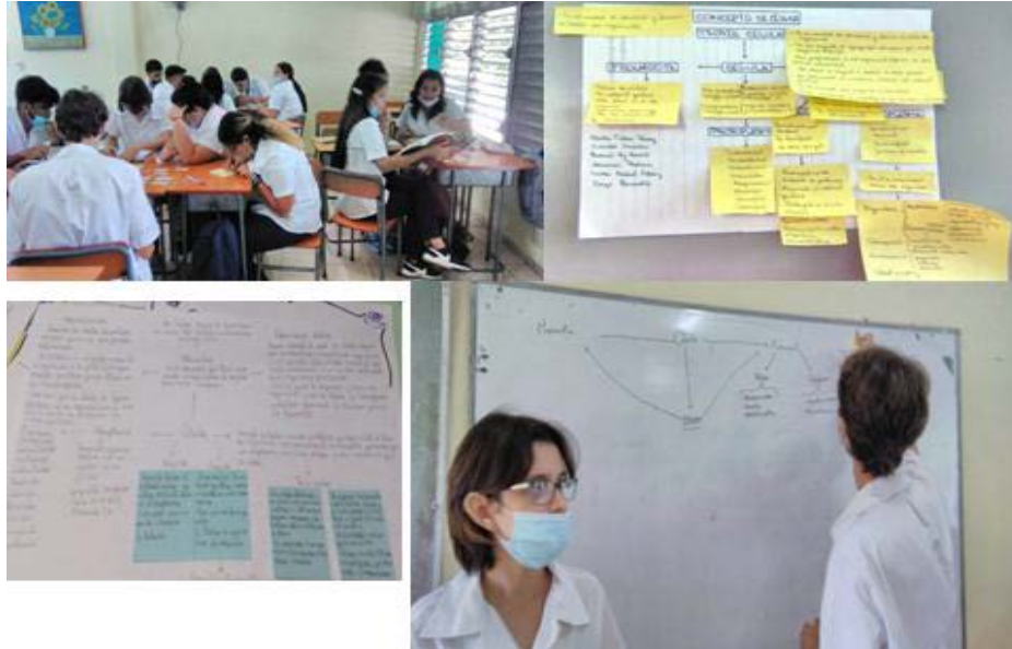
Figura 3. Exposición de la información de mapa conceptual confeccionado.

En los seminarios se realizó una discusión grupal de preguntas sobre el tema, cuyas respuestas debían presentarse mediante un mapa conceptual en un panel que representara la visión del equipo acerca de la resolución de dicho tema. Las preguntas fueron sorteadas al inicio de la sesión. Los equipos dispusieron de 10 minutos para construir el mapa conceptual, para después exponerlo verbalmente (Figura 3). Todos los estudiantes votaron por el mapa que expusiera la problemática con mayor creatividad, según las características que ya conocían de un mapa conceptual válido.