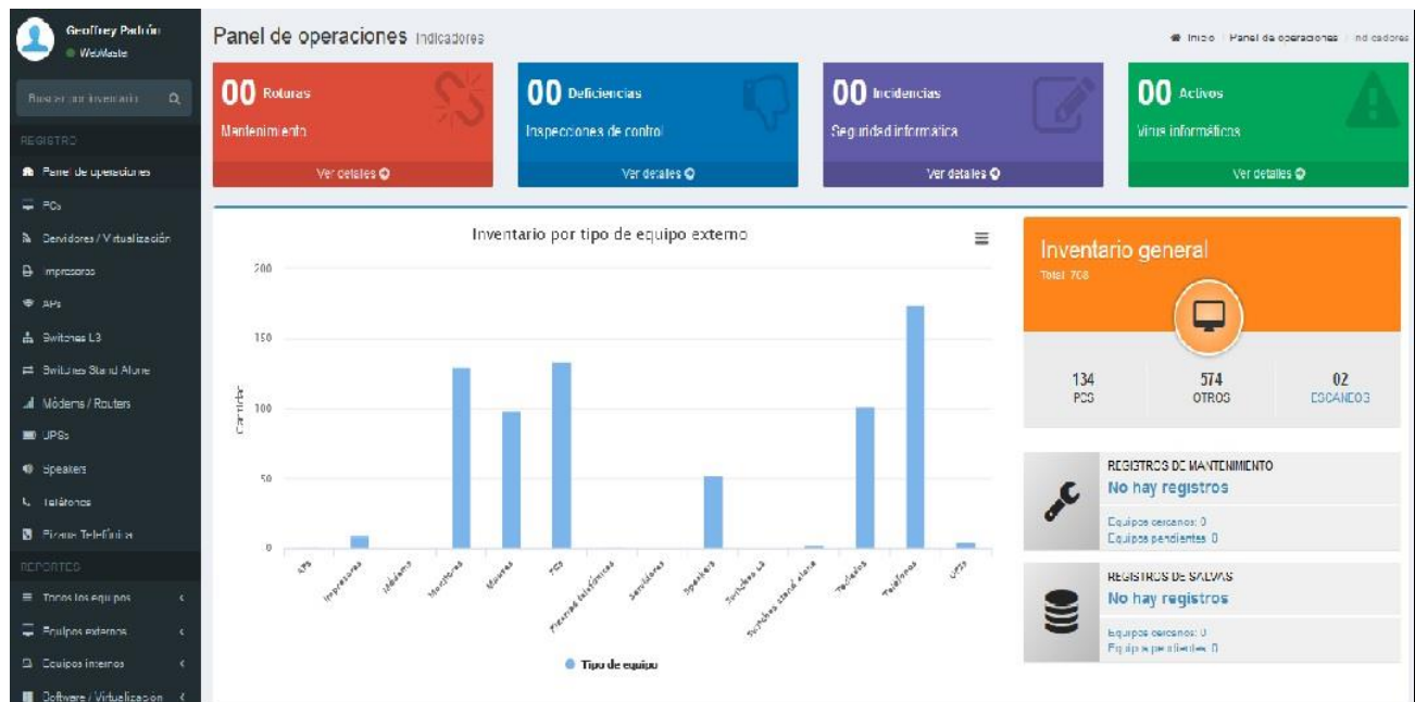
Figura 1. Ventana inicial de interacción de los usuarios con el CIMIOC

Ofrece un panel de operaciones (Figura 1), que se ajusta en dependencia del usuario autenticado.