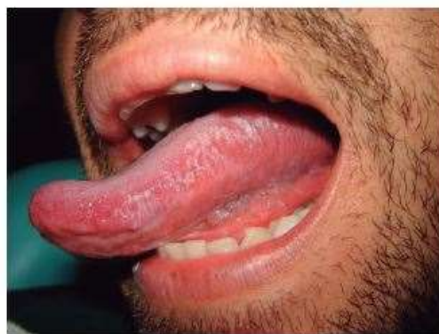
Fig. 1. Leucoplasia vellosa en borde lingual izquierdo